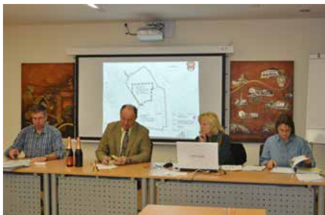
Auch die neue Technik hat Einzug im Sitzungssaal gehalten.

Folgende Anträge wurden im Gemeinderat behandelt und genehmigt: