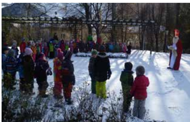
Text und Bild: Anneliese Dillersberger

Der Nikolaus kam in diesem Jahr nicht in die einzelnen Gruppen, sondern alle vier Gruppen machten sich auf die „Suche“ nach ihm. Und tatsächlich, wir trafen ihn am Musikpavillon. Er erzählte in kurzer Ausführung die Nikolaus – Legende und ermutigte die Kinder, hilfsbereit und rücksichtsvoll zu sein, und zu versuchen, andern eine Freude zu bereiten. Dies nahmen sich die Kinder gleich zu Herzen und bereiteten dem Nikolaus mit Liedern und einem Fingerspiel eine große Freude. Zum Schluss erhielt noch jedes Kind einen Lebkuchen.