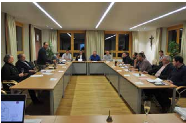
neue Sitzordnung in U-Form