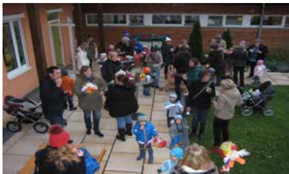
Text und Bild: Berta Bergmaier

Schön, dass so viele gekommen sind und das Wetter gehalten hat.