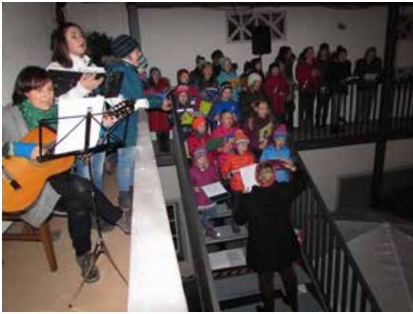
Der Flintsbacher Kinderchor auf dem Adventsmarkt

Sonntag, 4. Januar 2015, 19 Uhr „Inmitten der Nacht“ - Europäische Lieder und Weisen zur Weihnachtszeit -