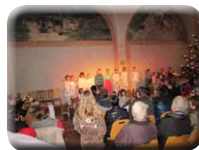
Impressionen vom Adventsmarkt 2014

Der Bürgermeister und die Gemeindeverwaltung wünschen allen Flintsbacher Bürgerinnen und Bürgern ein schönes Weihnachtsfest und ein gutes, gesundes neues Jahr 2015!