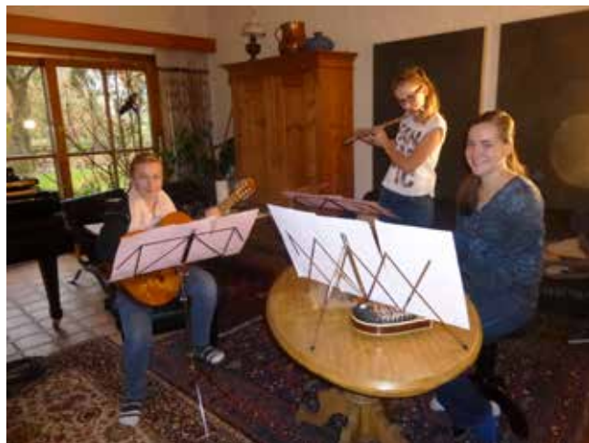
Text und Bilder: Petra Huber

Andere durch eine Spende unterstützen könnte. Vielen herzlichen Dank!