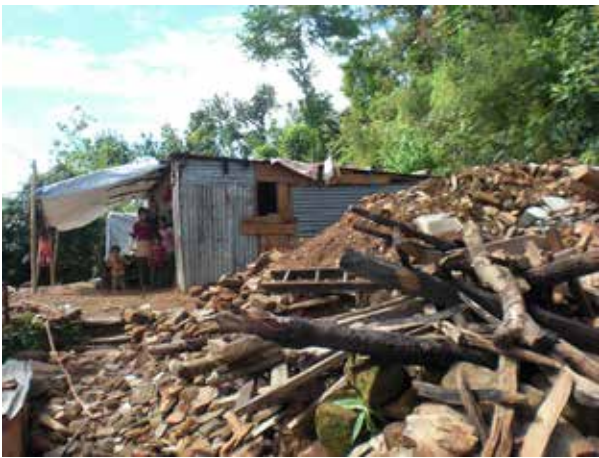
So fanden Sepp Obermair und seine Freunde im Juli 2015 die Erdbebenregion in Nepal vor.

Sepp Obermair wird weiterhin nach Nepal fahren um dort persönlich zu helfen und meinte abschließend wörtlich „jede Hilfe, auch wenn sie verglichen zur großen Not nur klein ist, bringt Hoffnung“.