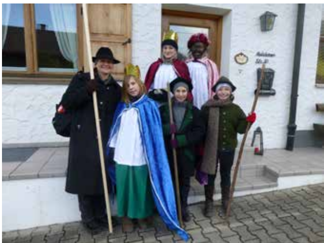
Flintsbacher Sternsinger unterwegs: Auf dem Bild eine der vielen Gruppen, die im Bereich Flintsbach/Fischbach 4.500 Euro sammelten und viel Freizeit in die Aktion steckten.