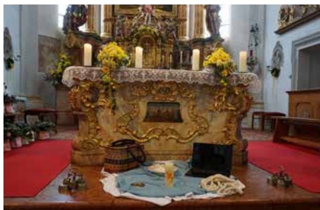
Feierlicher Gottesdienst in der Pfarrkirche