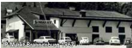
IP-Markt Brannenburg 1967

Bereits 1987 war der erste Frischemarkt in der Friedrich-Fuckel-Straße, auf dem Gelände des ehemaligen Holzlagerplatzes der Papierfabrik, entstanden. 1999 und 2015