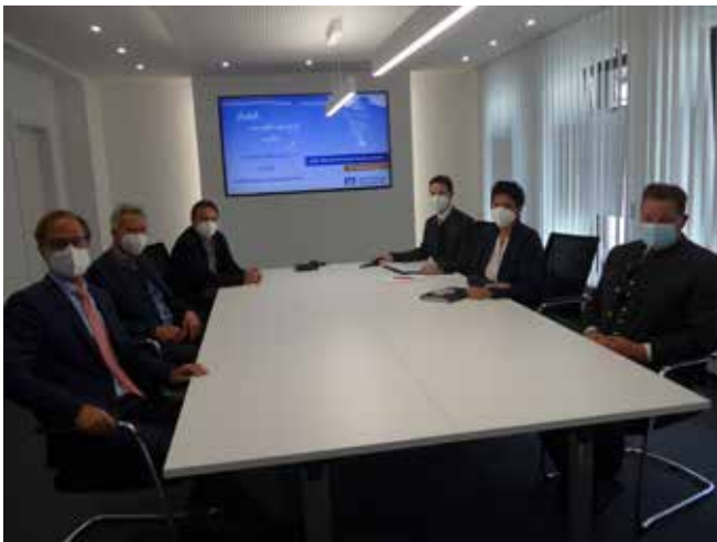
Vorstand und Aufsichtsrat der Raiffeisenbank Oberaudorf eG