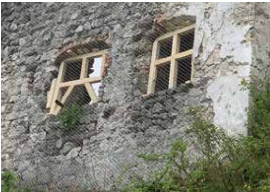
Nach der Sicherung