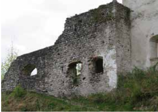
Vor der Sicherung

Das Gelände der Burg Falkenstein in Flintsbach konnte aufgrund von Frostschäden bis 12. Mai 2021 nicht betreten werden. Grund hierfür war, dass nicht ausgeschlossen werden konnte, dass sich aus der Mauer, die seitlich des Turms steht, Steine lösen. Die Schließung wurde genutzt, um den Hang zu sichern. Die Sicherungsarbeiten waren ursprünglich bis 20. Mai 2021 geplant, konnten jedoch schon früher fertiggestellt werden. Die Mauer war nicht Teil des Sanierungsprojekts von Burg Falkenstein.