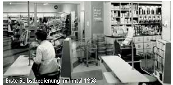
Erste Selbstbedienung im Inntal 1958

wurde hier bei laufendem Betrieb grundlegend umgebaut und erweitert; und bei seiner Eröffnung 2016 nahm der neue, großzügig gestaltete Supermarkt schließlich eine Vorreiterrolle in Süddeutschland ein. Seit 2003 ist auf dem Areal an der Rosenheimer Straße außerdem Mode Prechtl beheimatet.