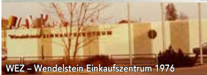
WEZ – Wendelstein Einkaufszentrum 1976