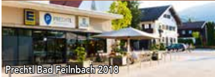
Prechtl Bad Feilnbach 2018