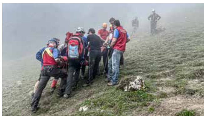
Bergwacht Rettungsaktion am Heuberg/Wasserwand. Einsatz mit der Gebirgstrage unter Seilsicherung.

Im weiteren Verlauf musste die Patientin von den Einsatzkräften zu Fuß mit der Gebirgstrage unter Seilsicherung bis zu den Daffnerwaldalmen transportiert und getragen werden, wohin dem Rettungshubschrauber auf Grund einer Wolkenlücke zwischenzeitlich der Anflug gelungen war. Die Besatzung des Hubschraubers übernahm die weitere Versorgung und brachte die Patientin in ein Krankenhaus. Am Einsatz beteiligt waren ca. 30 Einsatzkräfte der Bergwacht Brannenburg, mehrere Kameraden der Bergwacht Rosenheim-Samerberg, der Kriseninterventionsdienst (KID) der Bergwacht Bayern, der Rettungshubschrauber Christoph 14 sowie die Alpine Einsatzgruppe der Polizei (AEG).