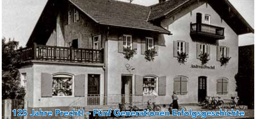
125 Jahre Prechtl – Fünf Generationen Erfolgsgeschichte

wurde hier bei laufendem Betrieb grundlegend umgebaut und erweitert; und bei seiner Eröffnung 2016 nahm der neue, großzügig gestaltete Supermarkt schließlich eine Vorreiterrolle in Süddeutschland ein. Seit 2003 ist auf dem Areal an der Rosenheimer Straße außerdem Mode Prechtl beheimatet.