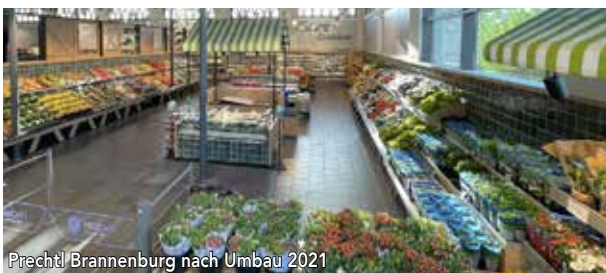
Prechtl Brannenburg nach Umbau 2021