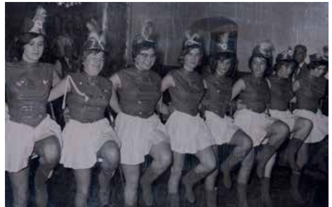
Garde 1961: „Erstmals trat im Jahr 1961 eine Prinzengarde im Fasching auf“

Ein Blick in die Zukunft zeigt, dass sowohl durch vermehrte Auflagen, wie zum Beispiel im Brandschutz und den Sicherheitskonzepten und aber auch den steigenden Ansprüchen (auch von uns) an einen gelungenen Faschingsball und Faschingszug, diese Veranstaltungen immer arbeitsintensiver und kostspieliger werden.