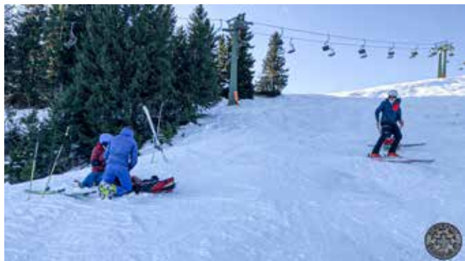
Ausbildung zur aktiven Bergwacht – Einsatzkraft, hier am Sudelfeld, im Bereich der Schöngrathütte. Der Akja wird zum Einsatz gebracht.

Die „neuen“ Anwärter müssen im Winter-Eignungstest vor allem zeigen, dass sie sich nicht nur auf der Piste, sondern auch im winterlichen alpinen Gelände mit Tourenskiern sicher bewegen können, sowohl bergauf als auch bergab.