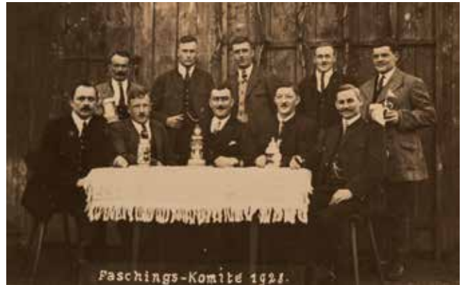
Erstes Faschingskomitee 1928: „Erstmals wurde 1928 eine Versammlung im Namen der Faschingsgesellschaft Flintsbach-Fischbach abgehalten.“

Seit nunmehr 133 Jahren organisiert die Faschingsgesellschaft Flintsbach-Fischbach den Fasching in Flintsbach und repräsentiert, als eine der ältesten Deutschlands, die Gemeinde im gesamten Landkreis. Doch ohne die tatkräftige Unterstützung der Flintsbacher Faschingsspinnerinnen und Faschingsspinner, in personeller, aber auch finanzieller Art, wäre das schon seit langem nicht mehr in diesem Umfang möglich. Hierfür noch einmal mehr ein herzliches Vergelts Gott.