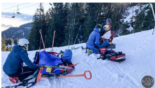
Versorgung des „Verletzten“ und Vorbereitung zum Transport durch Bergwachtanwärter.

Auf die „alten Hasen“ kommt nun die Winterprüfung zu. Dabei stehen unter anderem der sichere Patiententransport mit Akja auch in schwierigem Gelände, Schnee- und Lawinenkunde sowie die Suche von mehreren Verschütteten in einer Lawine mit dem LVS-Gerät auf dem Programm.