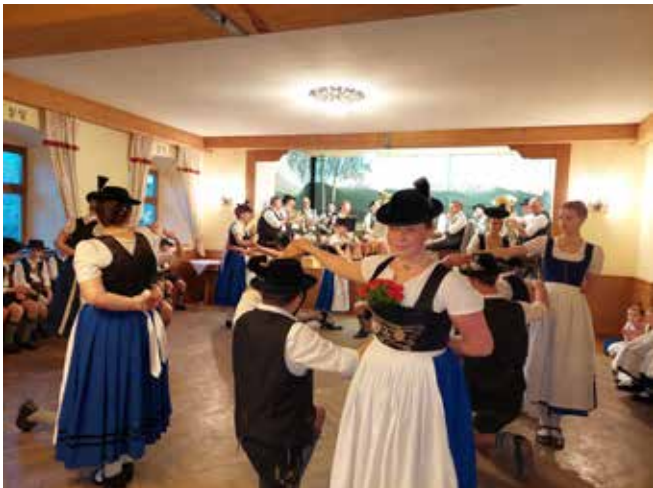
Die Jugend- und Aktivengruppe

Die Tänze und Plattler begleitete eine kleine Besetzung der Musikkapelle Flintsbach, die nach dem offiziellen Teil noch zur Unterhaltung aufspielte.